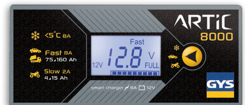
Facile da utilizzare